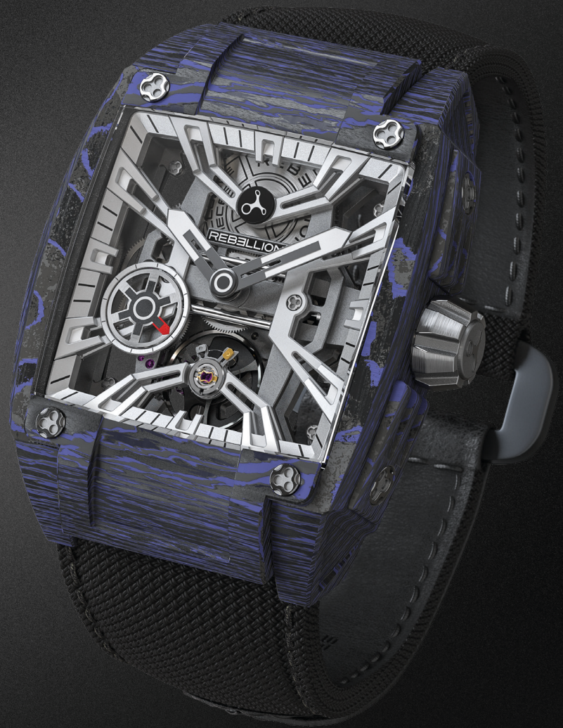
RE-VOLT 3 HANDS