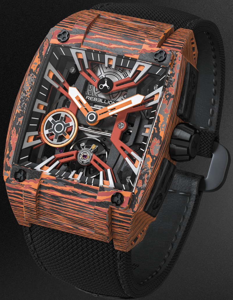
RE-VOLT 3 HANDS